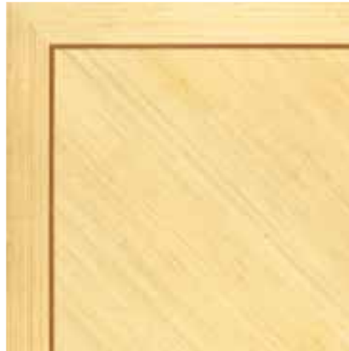
Diagonal mit Randfries